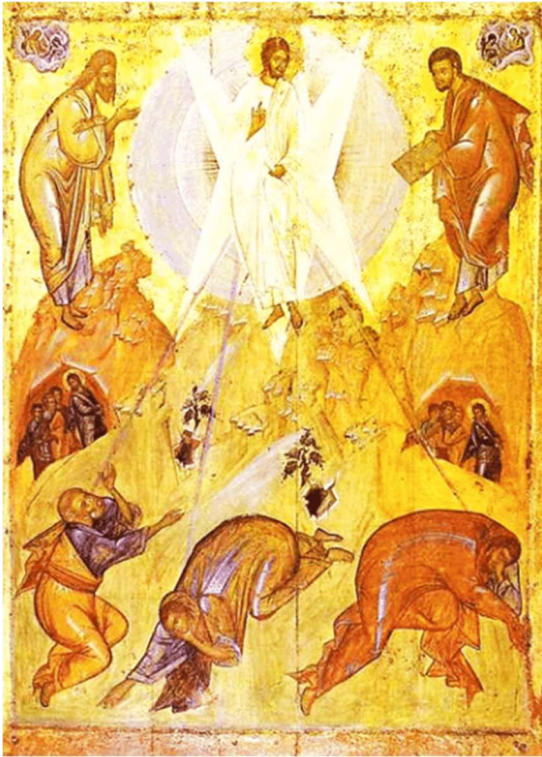
De transfiguratie van Christus op de berg met Elia Mozes, Petrus Johannes en Jacobus, Icoon ca 1400?